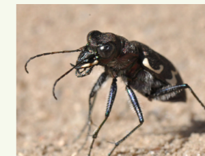
Wald-Sandlaufkäfer Cicindela sylvatica