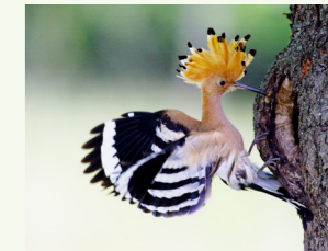
Wiedehopf Upupa epops