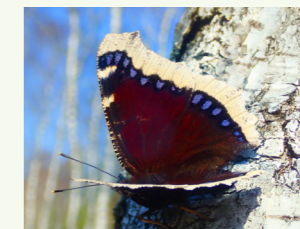
Trauermantel Nymphalis antiopa