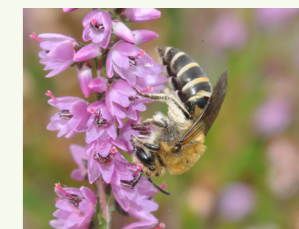
Heidekraut-Seidenbiene Colletes succinctus