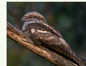
Ziegenmelker Caprimulgus europaeus