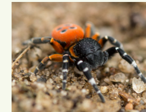
Rote Röhrenspinne Eresus kollari