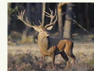
Rotwild Cervus elaphus